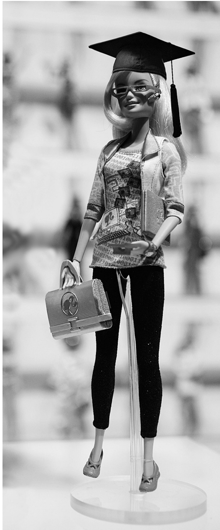
B. Ate Musterfrau, systemrelevante Leistungsträgerin

Die Bertelsmann Stiftung hat ein Stiftungsvolumen von 77,5 Mio. Euro (2008) und ist zu 77,4% (2009) Anteilseignerin der Bertelsmann AG, Europas größtem Medienkonzern. Sie hat damit als Eigentümerin der RTL Group (45 Fernsehsender, 31 Radiosender), Random House (120 Verlage in 19 Ländern), Direct Group (650 Club Center und Buchhandlungen) und Gruner + Jahr (ca. 285 Print- und Onlinemedien) eine beträchtliche Macht im öffentlichen Diskurs. Als zivilgesellschaftlicher Akteur initiiert und fördert sie gesellschaftliche Projekte und universitäre Forschung. Sie versteht sich nach eigenen Angaben „als ‚Motor‘, der notwendige Reformen initiiert und voranbringt“. (NBB)