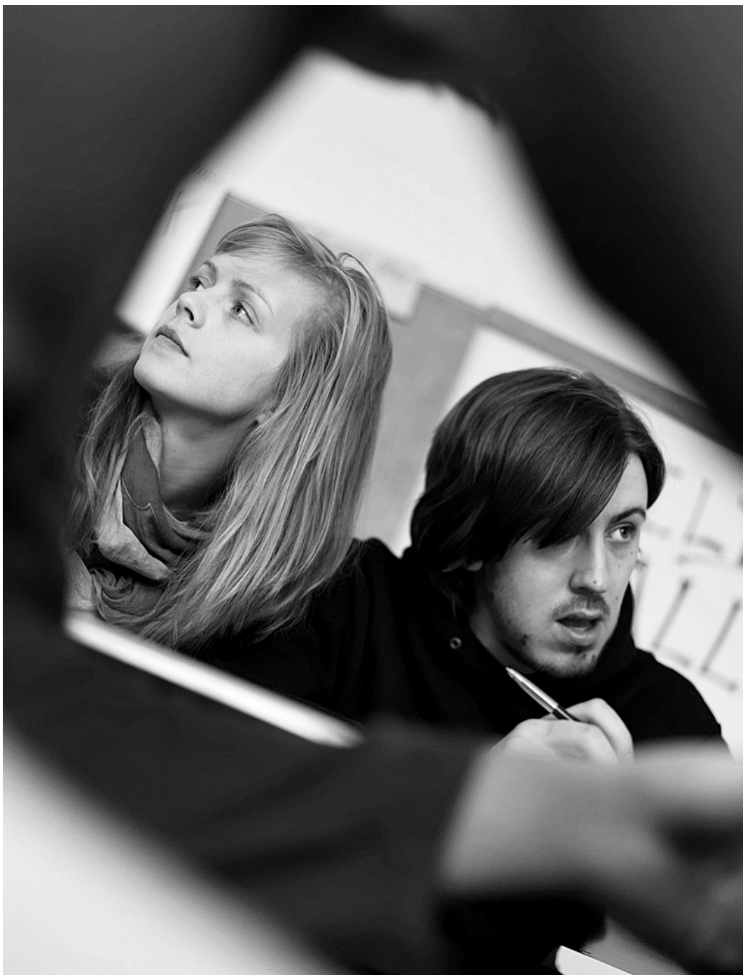
Den Herd fest im Blick: Sie lernt's, er schafft's

Wenn Frauen sich schon bei der Berufs- und Studienfachwahl vertun, wird die Karriereleiter schon auf der ersten Stufe gefährlich steil. Kommen Familienpläne dazu, wird der Aufstieg ein schwer zu bewältigender Drahtseilakt. Gepaart mit Rollenbeschreibungen, die aus Männern angriffslustige Alphas und aus Frauen kichernde Mitläuferinnen machen, entsteht eine tückische Kombination aus Fehlentscheidungen und Stereotype, die Frauen in deutschen Führungsetagen nur als Chefsekretärinnen zulässt. Würden al-