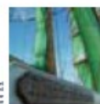
Das ist die Aufgabe der Stiftung für die Nordatlantische Expedition.

Das ist die Aufgabe der Stiftung für die Nordatlantische Expedition. Die Aufgabe der Stiftung für die Nordatlantische Expedition ist es, die Nordatlantische Expedition zu unterstützen. Die Aufgabe der Stiftung für die Nordatlantische Expedition ist es, die Nordatlantische Expedition zu unterstützen. Die Aufgabe der Stiftung für die Nordatlantische Expedition ist es, die Nordatlantische Expedition zu unterstützen.